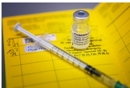
Kreuzimpfung mit AstraZeneca und BioNTech/Pfizer, 19. Juli 2021