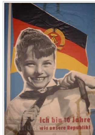
„Ich bin 10 Jahre – wie unsere Republik!“, Entwurf: Jahnke/Vallenthin, Druck: VEB Ratsdruckerei Dresden 1959.

Die in der traditionellen Historiografie gern gefeierte „Entdeckung der Kindheit“, mit der man nun endlich Rücksicht auf kindliche Gefühle genommen habe, wird in solchen Forschungen, welche die gezielte Formung kindlicher nationaler und imperialer Emotionen analysieren, vom Kopf auf die Füße gestellt. [69] Die häufige Nähe der Nation zur Kindheit ergibt sich vor allem aus der Primordialität beider Konstruktionen und ihrer hohen moralischen und emotionalen Aufladung; hinzu kommt interessanterweise bei vielen Nationalbewegungen das Selbstverständnis als „jung“. [70] Karen Sanchez-Eppler geht mit ihrer Formulierung „In the rearing of each and every child the processes of national formation are reproduced in miniature“ [71] wohl etwas weit. Doch von nationalen Aktivisten wurde und wird das Verständnis vom „child at risk“ tatsächlich gern eins zu eins auf die junge, gefährdete und schützenswerte Nation übertragen. „Deren“ Kinder, die als einzige Hoffnung für eine nationale Zukunft erschienen, mussten ebenso gehegt, gepflegt und geschützt werden wie die Nation selbst. 1959 behauptete ein Plakat aus der DDR den Erfolg solcher Strategien, und ein strahlendes Pionierkind verkündete: „Ich bin 10 Jahre – wie unsere Republik!“