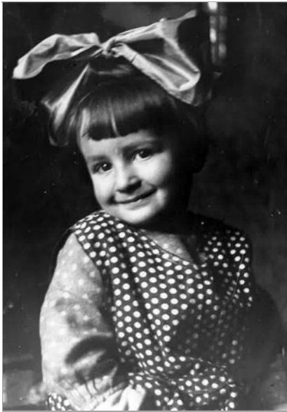
Spuren einer bürgerlichen Kindheit im Mitteleuropa der 1920er-Jahre.