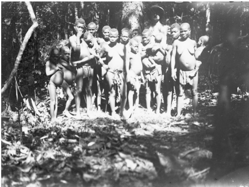
Fotosammlung der Innerafrika-Expedition des Herzogs Adolf Friedrich zu Mecklenburg 1910/11. Expeditionsteilnehmer, vermutlich der Herzog, posiert mit den „Pygmäen“ von Bomanjok in Mbiangele bei Yukaduma im Osten Kameruns. Nummer: 2016.13:1805.

König Njoya, Herrscher des Königreichs Bamum im Grasland von Kamerun, auf seinem berühmten perlenbesetzten doppelseitigen Thron während einer Audienz. Nummer F19336.