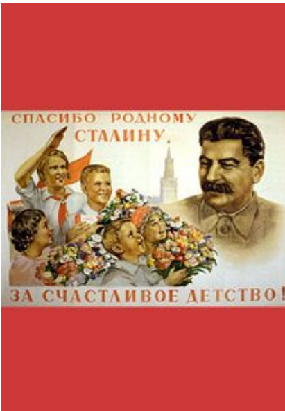
Stalin-Poster von Nina Nikolaevna Vatolina: „Danke unserem lieben Stalin für die glückliche Kindheit!“ - Moskau/Leningrad 1939