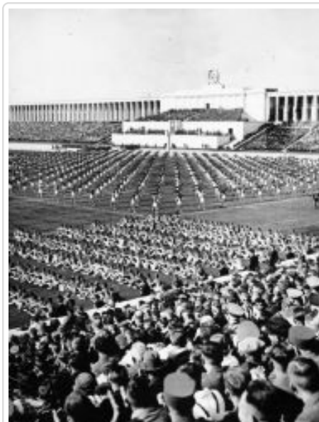
Reichsparteitag in Nürnberg. Am 8.9.1938, dem "Tag der Gemeinschaft", finden auf der Zeppelinwiese Massen-Freiübungen statt.

Im politischen Spektrum Weimars versuchte sowohl die radikale Linke als auch die Rechte, eine Diktatur zu errichten. Während die KPD sich dem sowjetischen Vorbild bald unterordnete, kursierten auf der Rechten verschiedenste Ordnungsvorstellungen, von denen die Nationalsozialisten nur eine Spielart antiliberalen Denkens darstellten. [29] In seiner Selbstbeschreibung der nationalsozialistischen Bewegung und ihrer Ziele vermied Adolf Hitler den Diktaturbegriff. Seine Ausführungen in „Mein Kampf“ widmeten sich mehr den „rassischen“ Grundlagen einer zukünftigen Ordnung als ihrer Form. [30] Aus seiner Ablehnung der parlamentarischen Demokratie machte er