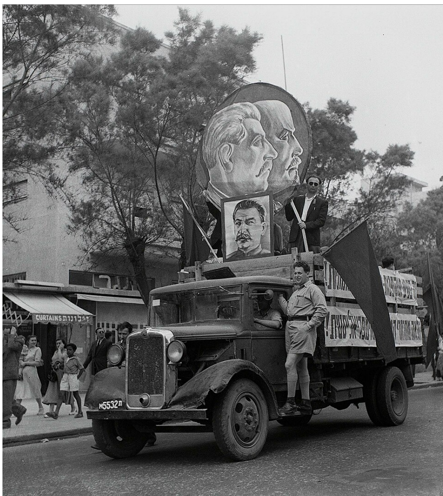
Ein Lastwagen mit den Gesichtern der sowjetischen Kommunistenführer Lenin und Stalin bei der Parade zum Tag der Arbeit in Tel Aviv am 1. Mai 1949.

Dieser Artikel ist Teil des Themendossiers: „un.sichtbar. Blicke auf das Fotoalbum einer jüdischen Familie 1904-1969“, herausgegeben von Christine Bartlitz, Christoph Kreuzmüller und Theresia Ziehe