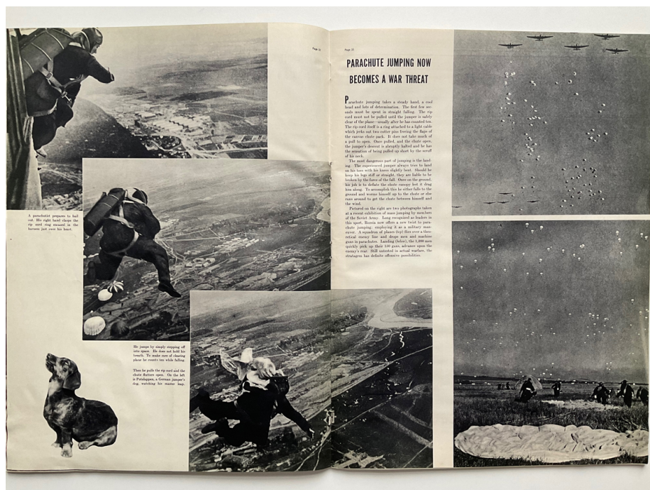
Abb. 1: Parachute jumping now becomes a war threat, in: Life, No. 12, March 22, 1937, S. 28-34 ©