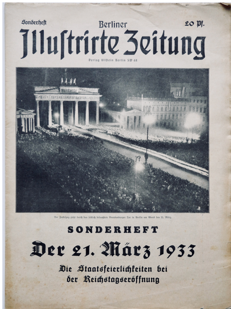
Abb. 4: Berliner Illustrierte Zeitung, Sonderheft „Der 21. März 1933. Die Staatsfeierlichkeiten bei der Reichstagseröffnung“