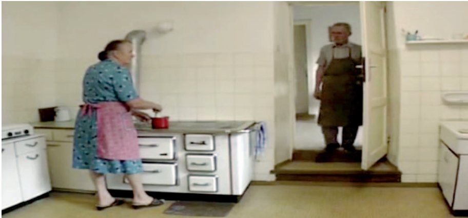
Video 3: Ausschnitt aus Der Letzte seines Standes?: Der Faßbinder (D 1993, Regie: Benedikt Kuby), 16:06–17:20

Zwei Strategien sind bei diesem dritten Paradoxon entscheidend: Eine erste, etablierte Strategie ist die Negierung von Medialität, die zugleich die Inszenierung von Unmittelbarkeit bedeutet. Dabei werden Instanzen der Medialisierung und Dramatisierung negiert und stattdessen als unmittelbare, also nicht-vermittelte und nicht-manipulierte Formen des Sehens und Erlebens inszeniert. Diesen Eindruck soll etwa die vorgeblich nicht anwesende Kamera als »fly on the wall« erzeugen, die das »natürliche« Verhalten der Protagonist*innen beobachtet, scheinbar ohne von diesen wahrgenommen zu werden. Im TV-dokumentarischen Format des Handwerksfilms ist dies eine beliebte Einstellung, nicht nur für das Zeigen der Arbeitsabläufe, sondern auch für Sequenzen, die Privatheit und Intimität vermitteln sollen.