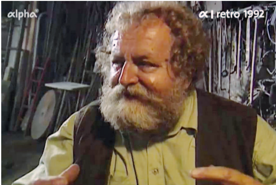
Video 2: Ausschnitt aus Der Letzte seines Standes? Der Schmied (D 1993, Regie: Benedikt Kuby), 18:42–19:20