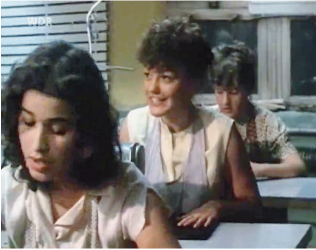
Video 3: Ausschnitt aus Ein Stück Himmel , Folge 10 – Licht über dem Wasser (BRD 1986, Regie: Franz Peter Wirth), 1:35:21–1:35:58