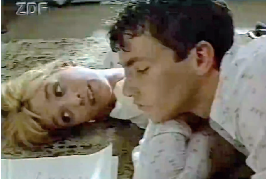
Video 1: Ausschnitt aus Bronsteins Kinder (D 1990/91, Regie: Jerzy Kawalerowicz), 0:42:54–0:43:37