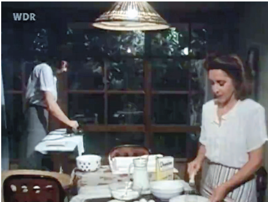
Video 5: Ausschnitt aus Ein Stück Himmel , Folge 10 – Licht über dem Wasser (BRD 1986, Regie: Franz Peter Wirth), 1:37:13–1:38:16

Insgesamt zeichnet die Autobiografie ein ambivalentes Bild der Volksrepublik und der polnischen Bevölkerung. Die Leser*innen von Ein Stück Himmel erhalten eine differenzierte Beschreibung der politischen Kultur und Mentalität in Polen, die laut David es den Nationalsozialisten leichter gemacht habe, die jüdische Bevölkerung zu ermorden – oftmals mit aktiver Hilfe von Polen, die Juden denunzierten, deren Eigentum konfiszierten oder von den frei werdenden Arbeitsstellen profitierten. Eine deutlich geringere Rolle spielen der polnische Antisemitismus und Antijudaismus in der filmischen Adaption. Da eine zu ausführliche Auseinandersetzung hiermit die deutsche Schuld relativiert hätte, verwundern die Auslassungen aber nicht. Vor dem Hintergrund, dass Ein Stück Himmel auch für das Ausland produziert wurde, war an eine revisionistisch auslegbare Interpretation der deutschen Geschichte nicht zu denken. Polnische Antisemiten zu zeigen, hätte ein problematisches Entlastungsnarrativ bedeutet. Auch hier musste sich der Authentizitätswunsch dem Aussagewunsch unterordnen.