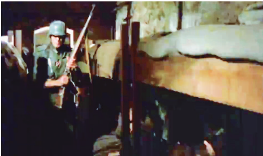
Video 4: Ausschnitt aus Ein Stück Himmel , Folge 8 – Die letzten Tage des Krieges (BRD 1982, Regie: Franz Peter Wirth), 0:00:31–0:02:24

Als Regisseur hatte Wirth freilich das letzte Wort, die Szene mit dem »guten Wehrmachtsoffizier« wurde getilgt. Demnach musste sich der Wunsch nach Au-