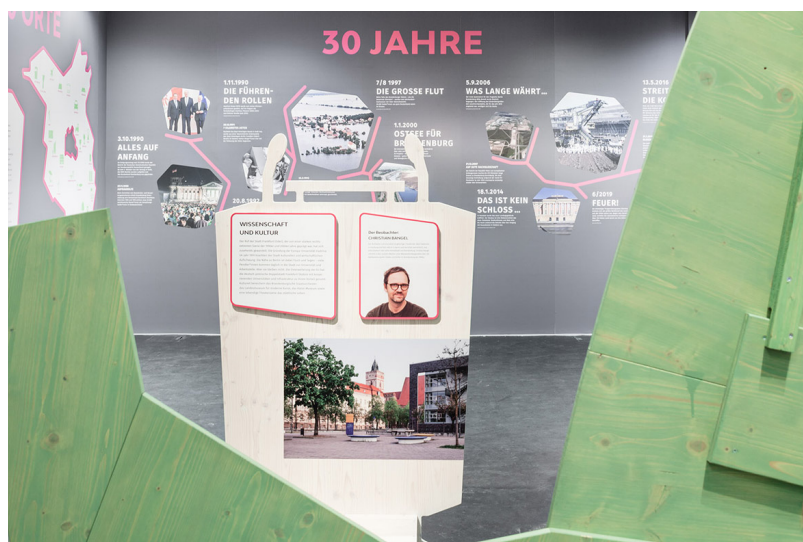
Blick in die Ausstellung: „Mensch Brandenburg! 30 Jahre, 30 Orte, 30 Geschichten“, Haus der Brandenburgisch-Preußischen Geschichte, Potsdam, 30. September 2020.

Ende September 2020 ist im Haus der Brandenburgisch-Preußischen Geschichte in Potsdam die Ausstellung „Mensch Brandenburg! 30 Jahre, 30 Orte, 30 Geschichten“ eröffnet worden. Anlässlich des 30. Jahrestags der Gründung des Bundeslands unternimmt die Ausstellung eine Entdeckungsreise zu 30 Orten und den damit verbundenen Themen und Menschen, die Brandenburg in den letzten 30 Jahren geprägt haben: verwaiste Landstriche und boomende Metropolregionen, verschwundene Orte und neue Seenlandschaften, wortkarge Menschen und Geschichtenerzähler, die Treuhand, der Wolf, die Braunkohle, der BER – und nicht zuletzt sehr viel Natur. Neben den Porträts von 30 Menschen, die über ihre Arbeit und ihr Engagement erzählen, wird jeder vorgestellte Ort in der Ausstellung visuell gerahmt. Die Fotografien erzählen von der Zeit der Transformation nach 1989, von den politischen und strukturellen Umbrüchen der letzten drei Jahrzehnte.