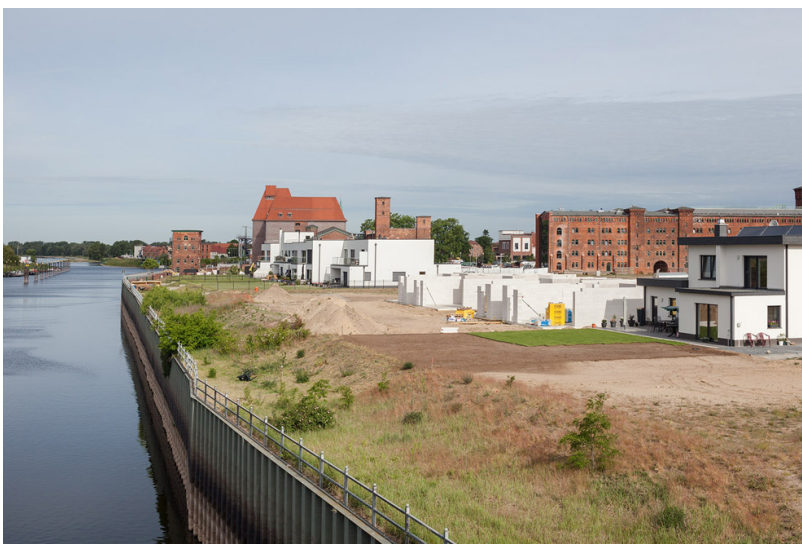
„30 Orte“: Wittenberge. Blick zum Stadthafen und zur Hafensperrmauer, rechts eine neue Eigenheimsiedlung, dahinter die Alte Ölmühle sowie das historische Speicherensemble. Wittenberge, 2020.

Ich habe im März 2020 mit der Arbeit begonnen. Das fiel genau mit dem ersten Lockdown zusammen. Daher war es erstaunlich ruhig in Brandenburg. Mit dieser Stimmung hatte ich natürlich nicht gerechnet, als ich für das Projekt angefragt worden bin. Ich habe die Orte weitestgehend menschenleer vorgefunden. Sie wirkten dadurch so zeitlos.