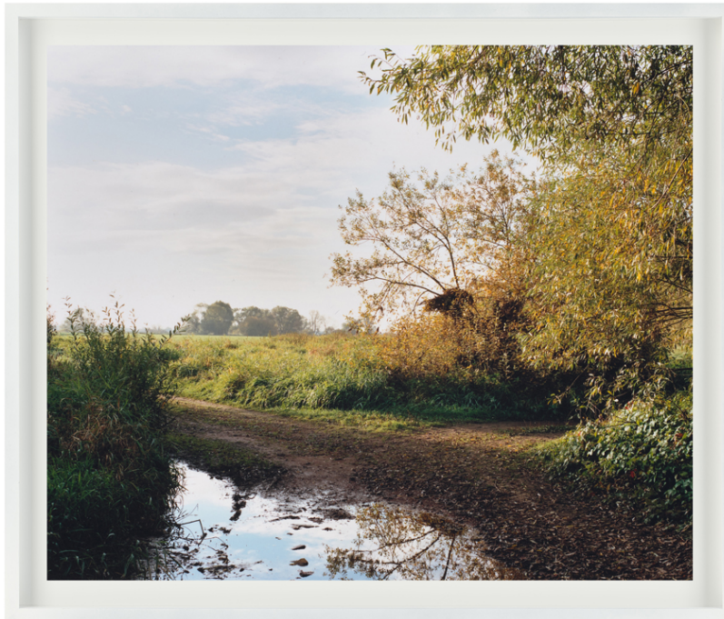
Weg zu den Flusswiesen, aus der Serie „Gottes Aue“, 2015.

In Ihrer künstlerischen Arbeit beschäftigen Sie sich mit dem postsozialistischen Wandel Ostdeutschlands. So gibt es zum Beispiel von Ihnen eine Foto-Text-Arbeit mit dem Titel „Gottes Aue“, in der Sie das Ende des Braunkohletagebaus in Bitterfeld und die rekultivierte Landschaft zeigen. In der Serie „Luft Schiffe“ haben Sie eigene Bilder und Texte mit gefundenem Archivmaterial kombiniert und auf diese Weise zu einer Erzählung verdichtet. Wie finden Sie Ihre Bilder und Themen? Gehen Sie auch ins Archiv und schauen sich Akten an? Arbeiten Sie manchmal sogar wie ein Historiker?