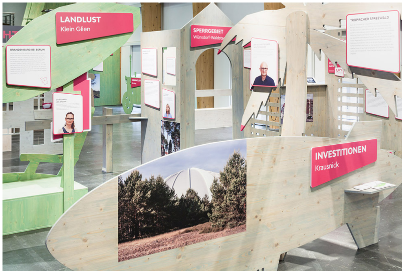
Blick in die Ausstellung: „Mensch Brandenburg! 30 Jahre, 30 Orte, 30 Geschichten“, Haus der Brandenburgisch-Preußischen Geschichte, Potsdam, 30. September 2020.

Christine Bartlitz: Herr Gatter, was fotografieren Sie am liebsten?