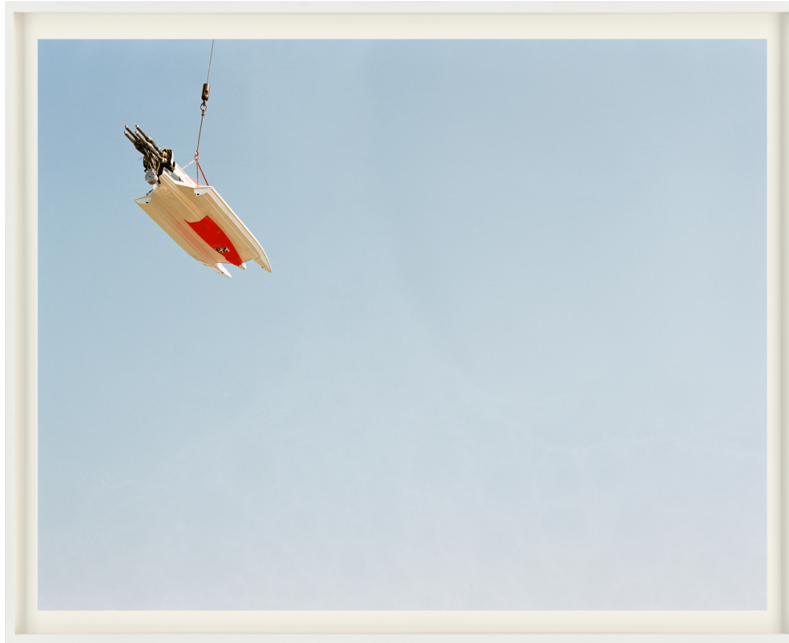
Luft Schiffe II, aus der Serie „Luft Schiffe“, 2015.