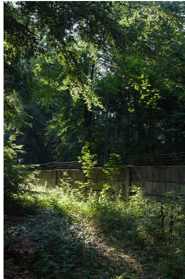
„30 Orte“: KKW Rheinsberg. Blick auf den Sperrbereich um das Gelände des KKW Rheinsberg, 2020.

Kernkraftwerk Rheinsberg beispielsweise bin ich herumgelaufen, soweit es möglich war, und habe dabei bestimmt 100 bis 150 Bilder geschossen. Auch während der Führung vor Ort habe ich versucht, so viel Material wie möglich zu sammeln und auf den Bildern ein Stück weit dieses „Sichhindurchbewegen“ festzuhalten. Es war vorher abgesprochen, dass die Bilder aufgrund des Ausstellungskonzepts in Farbe sein sollten, um die Zeitebenen nicht zu verunklaren.