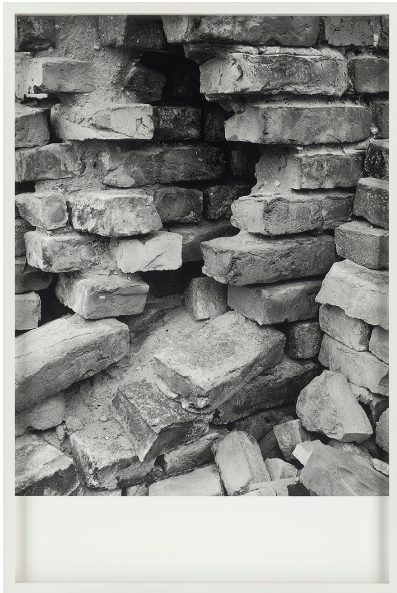
Modell und Architektur: Ecke, aus der Serie „Echo Tektur“, seit 2018 (work in progress) Ort und Datum.