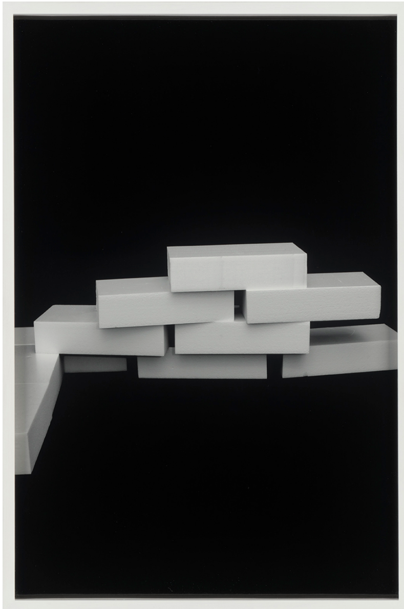
Modell und Architektur: Mauerwerk, aus der Serie „Echo Tektur“, seit 2018 (work in progress).