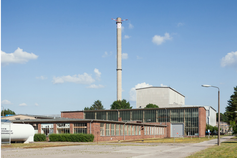
„30 Orte“: KKW Rheinsberg. Blick auf den Sperrbereich um das Gelände des KKW Rheinsberg, 2020.

Sie haben 30 Einzelporträts von Menschen gemacht, die im Rahmen der Ausstellung über ihre Arbeit und ihr Engagement in den letzten 30 Jahren in Brandenburg erzählen. Ist es eigentlich schwer, Porträtfotos zu machen?