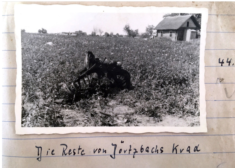
Abb. 12: „Die Reste von Dörtzbachs Krad“, in der Nähe von Lotaki (Russland), August 1941, 6×9-cm-Abzug

Anschließend folgt das Foto von Dörtzbachs Grab, das Pechmann wie schon im Fall der toten Soldatin mit einem Zitat beschriftete (Abb. 13): „Ich hatt einen Kameraden“. [60] Nach Sichtung des Tage- und Fotobuchs bleibt die Frage bestehen, ob neben der Trauer über den Verlust eines Kameraden nicht auch der spektakuläre Umstand von Dörtzbachs Tod ausschlaggebend war, genau diesen Fall durch Fotos zu dokumentieren.