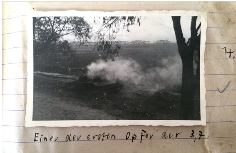
Abb. 3: „Einer der ersten Opfer der 3,7“, in der Nähe von Brest (Weißrussland), Juni 1941, Foto: Karl-Heinrich von Pechmann, 6x9-cm-Abzug, Quelle: Bundesarchiv Freiburg (Abt. Militärarchiv), MSG 2/14646

Dem Foto des Bugübergangs folgt das Bild eines am Straßenrand stehenden noch rauchenden russischen Panzers: „Einer der ersten Opfer der 3,7“ steht darunter geschrieben (Abb. 3). [24] Die gewaltsame Grenzüberschreitung führt zum ersten sichtbaren militärischen Erfolg oder zum ersten „Opfer“, wie es der Albumautor nennt. Bilder der Zerstörung gehören von Anbeginn zu den beliebtesten Motiven fotografierender Soldaten. [25] Der Kriegsbeute konnte man auch symbolisch habhaft werden, indem der zerschossene Panzer auf einem Bild festgehalten und fortan mitgeführt wurde. Besonders in dem vorliegenden Fall kann auch argumentiert werden, dass es bei Motiven der Zerstörung meist um den Beweis der Schlagkraft der eigenen Waffen ging, wobei speziell die hier erwähnte 3,7 cm PAK sich schon im Krieg gegen Frankreich als eher unzuverlässig gegen feindliche Panzer erwiesen hatte. [26] Vielleicht sollte mit diesem Foto ein Gegenbeweis erbracht werden.