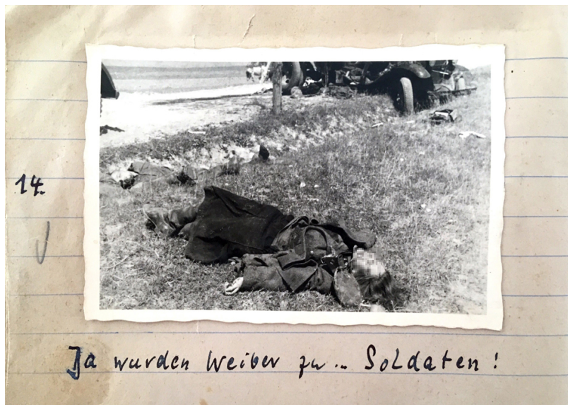
Abb. 10: „Da wurden Weiber zu ... Soldaten!“, in der Nähe von Slonim (Weißrussland), Juni/Juli 1941, Foto: Karl-Heinrich Pechmann, 6×9-cm-Abzug, Quelle: Bundesarchiv Freiburg (Abt. Militärarchiv), MSG 2/14646. Aus ethischen Gründen wurde das Gesicht der unbekanntes getöteten russischen Soldatin durch eine Verpixelung unkenntlich gemacht.

Da Pechmann seine Fotografien nicht mit Daten versehen hat, wurde in diesem Fall aufgrund der Motive und einiger Bildunterschriften eine Reihe von sechs Fotos dem oben geschilderten Gefecht zugeordnet. [48] Während die ersten fünf Fotos Momentaufnahmen des Kampfes sind – meist weite Steppen, auf denen Soldaten, Geschütze und anderer militärischer Fuhrpark versammelt sind –, zeigt das letzte Foto dieser Reihe die Leiche einer Frau in Uniform [49] (Abb. 10). Darunter steht geschrieben: „Da wurden Weiber zu ... Soldaten!“ Eine genauere Zuordnung dieser Fotografie zu den im Tagebuch beschriebenen Ereignissen ist nicht möglich. Ob diese Soldatin also während der Gefechte am 30. Juni und 1. Juli zu Tode kam oder aber zu den erschossenen Kriegsgefangenen gehörte, ist nicht mehr rekonstruierbar.