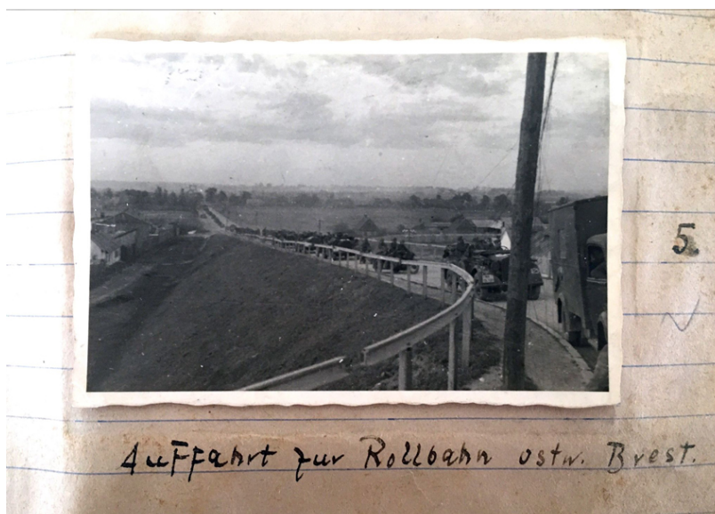
Abb. 4: „Auffahrt zur Rollbahn ostw[ärts]. Brest“, Weißrussland, Juni 1941, Foto: Karl-Heinrich von Pechmann, 6x9-cm-Abzug, Quelle: Bundesarchiv Freiburg (Abt. Militärarchiv), MSG 2/14646

Der Tag nach dem Angriff beginnt laut Tagebuch mit dem „Marsch auf Rollbahn I nach Ostrand Brest, dort nach Osten“, was durch Bild Nr. 5 mit dem Titel „Auffahrt zur Rollbahn ostw[ärts]. Brest“ illustriert wird (Abb. 4).