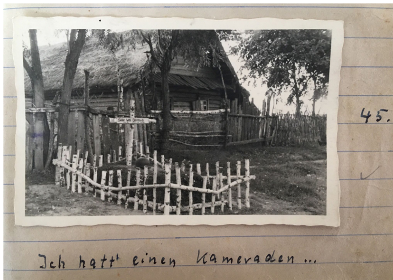
Abb. 13: „Ich hatt einen Kameraden“, in der Nähe von Lotaki (Russland), August 1941, Foto: Karl-Heinrich Pechmann, 6×9-cm-Abzug, Quelle: Bundesarchiv Freiburg (Abt. Militärarchiv), MSG 2/14646

Anschließend folgt das Foto von Dörtzbachs Grab, das Pechmann wie schon im Fall der toten Soldatin mit einem Zitat beschriftete (Abb. 13): „Ich hatt einen Kameraden“. [60] Nach Sichtung des Tage- und Fotobuchs bleibt die Frage bestehen, ob neben der Trauer über den Verlust eines Kameraden nicht auch der spektakuläre Umstand von Dörtzbachs Tod ausschlaggebend war, genau diesen Fall durch Fotos zu dokumentieren.