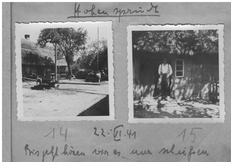
Abb. 5 und 6: „Bis jetzt hören wir es nur schießen“, Hohensprindt (heute Priosjorje), in der Nähe von Kaliningrad (Russland), 22.06.1941, 5,5×5,5-cm-Abzug