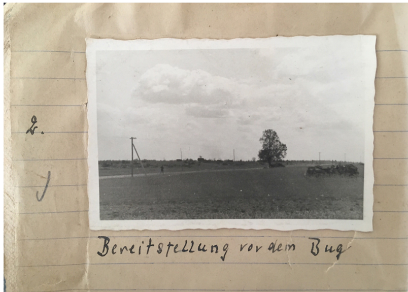
Abb. 1: „Bereitstellung vor dem Bug“, in der Nähe von Brest (Weißrussland), Juni 1941, Foto: Karl-Heinrich von Pechmann, 6×9-cm-Abzug, Quelle: Bundesarchiv Freiburg (Abt. Militärarchiv), MSG 2/14646

Fünf Fotos mit anderen Motiven können aber dem Zeitrahmen der ersten Tage des Überfalls zwischen dem 16. und dem 23. Juni zugeordnet werden. [18] Das erste in diesem Zusammenhang zu betrachtende Bild ist das zweite im Fotoheft und wurde kurz vor dem Angriff gemacht (Abb. 1). [19]