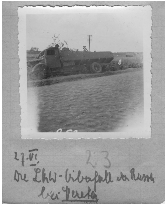
Abb. 9: „Die LKW-Überfall [sic!] der Russen bei Nereta“, Lettland, 27.06.1941, 5,5x5,5-cm-Abzug