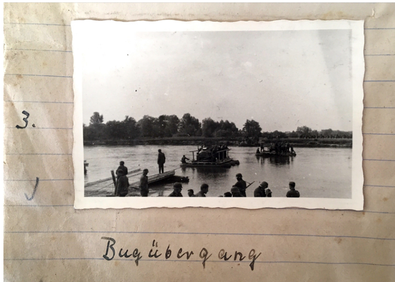
Abb. 2: „Bugübergang“, in der Nähe von Brest (Weißrussland), Juni 1941, Foto: Karl-Heinrich von Pechmann, 6x9-cm-Abzug, Quelle: Bundesarchiv Freiburg (Abt. Militärarchiv), MSG 2/14646

Russland beginnt mit einem Abbild der Ruhe vor dem Sturm.