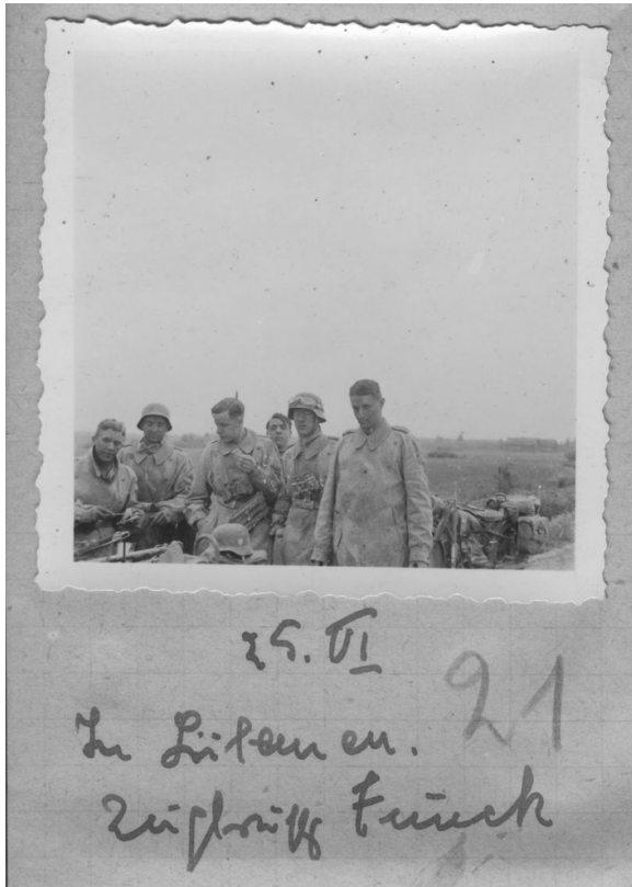
Abb. 7: „In Litauen. Zugtrupp Funk“, in der Nähe von Šiaulėnai (Litauen), 25.06.1941, 5,5x5,5-cm-Abzug