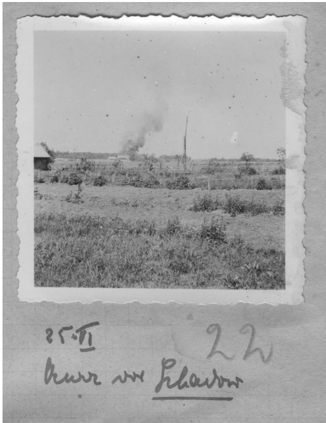
Abb. 8: „Kurz vor Schadow“, in der Nähe von Šeduva (Litauen), 25.06.1941, 5,5x5,5-cm-Abzug

nehmen soll. Pioniere sollen den Bahnhof ausräuchern. Die Russen sind aber geflüchtet.“ Bei dem Städtchen Schadow handelte es sich um einen wichtigen Bahnknotenpunkt, den es zu erobern galt. [35]