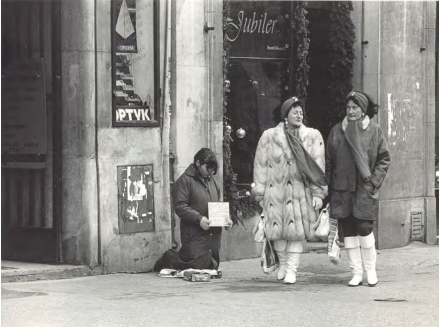
Krakau, Polen, 1992

einverleiben lässt. Um etwas aufzuzeigen, ist es immer besser, sich ein Stück herauszunehmen und einen größeren Überblick zu haben. Auch später war es mir immer wichtig, die verschiedenen Seiten mit auf das Bild zu bekommen. Natürlich muss man zugleich aber seinen Standpunkt behalten, das ist ganz wichtig, sonst wird die Arbeit Larifari.