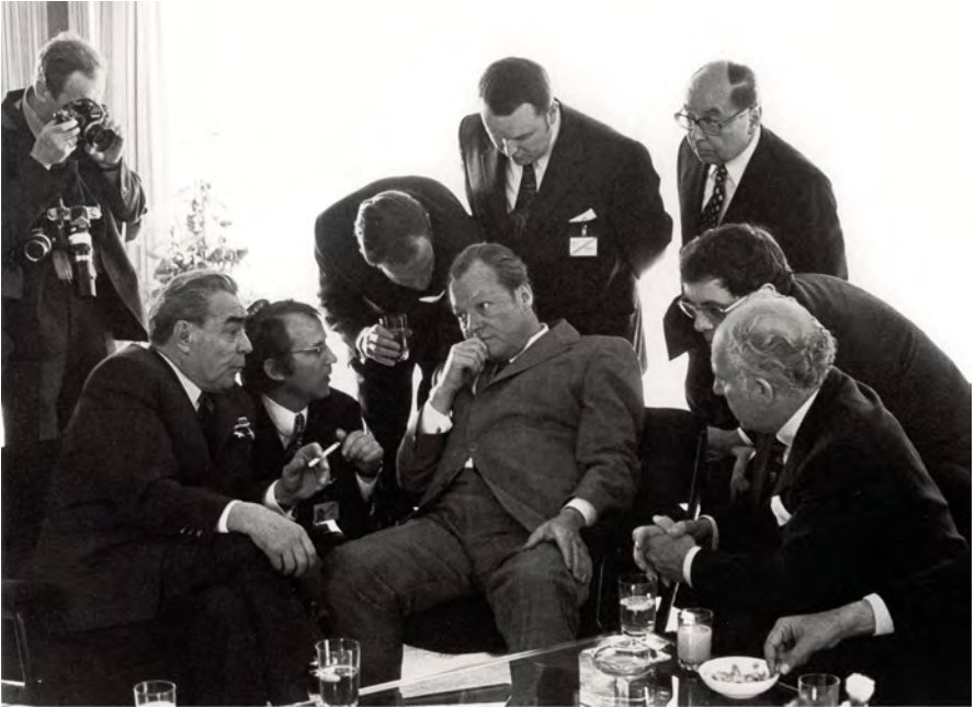
Leonid Breschnew, Willy Brandt, Bonn 1973

grafien und zwei Russen, aber sonst kein Kamerateam. Ich habe mit zwei Kameras gearbeitet, auf der einen ein Tele-, auf der anderen ein Weitwinkelobjektiv. In solchen Situationen hat man immer Angst, dass man hinausgeworfen wird, dass es nur ein paar Minuten geht. In diesem Fall – es war mein erstes politisches Großereignis – habe ich Glück gehabt, und ein Ergebnis war das Bild von Brandt und Breschnew, das für die Ostverträge und die ganze politische Entwicklung steht.