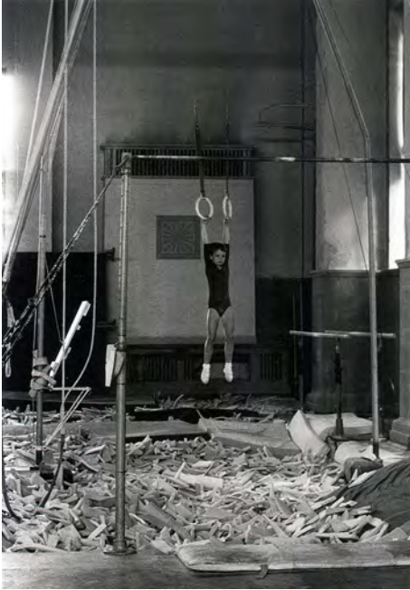
Deutsche Hochschule für Körperkultur, Leipzig 1970

wegen, ohne dass man einen Aufpasser dabei hatte. Inwieweit man unbemerkt überwacht wurde, weiß ich nicht. Ich bin jedenfalls immer geschlendert und habe auf der Straße fotografiert, was es zu sehen gab. In Leipzig waren wir auch im Hochleistungszentrum für Sportler; dort habe ich 1970 ein Mädchen an den Ringen aufgenommen. Oder ich bin in eine Schule hineingegangen und habe im Flur fotografiert. Ich habe es einfach probiert, und es gab ganz selten Ärger.