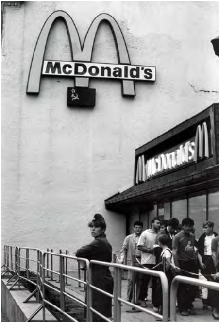
Moskau, Russland, 1991

Haben Sie eventuell vor, eine größere Retrospektive Ihrer Arbeiten zu machen, damit man den größeren Werkzusammenhang sehen kann, oder möchten Sie eher bestimmte Schwerpunkte neu erschließen – zum Beispiel die Architekturfotografie?