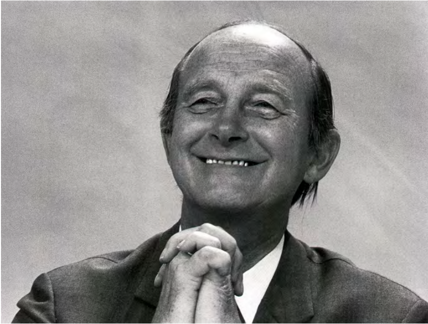
Hans Filbinger, CDU-Parteitag, Saarbrücken 1971

Brandt 1972, wie Rainer Barzel da in seinen Stuhl zurücksackt und es kaum fassen kann, dass er es nicht gepackt hat.