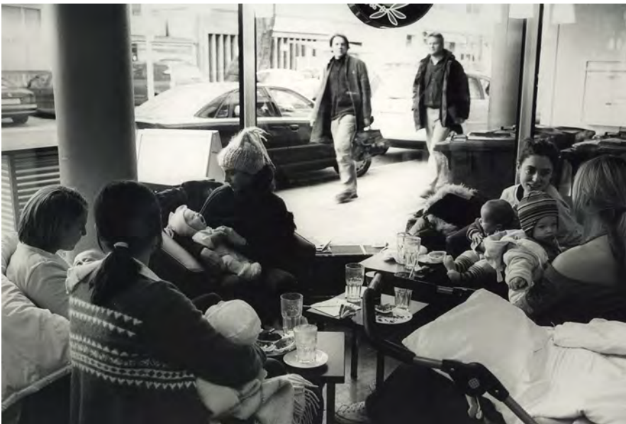
Frankfurt a.M., 2005

Darüber habe ich noch kaum nachdenken können. Natürlich möchte ich weiterhin fotografieren. Gestern, als ich von einer Reise zurückkam, bin ich in Frankfurt einfach losgelaufen und schaute in ein Café. Da sah ich fünf Mütter mit ihren Säuglingen in einer Ecke sitzen und habe gesagt, dass sie alle so reizend aussehen mit ihren kleinen Kindern und ich sie gern fotografieren möchte. Ich glaube, es ist ein schönes Bild geworden, und so ergeben sich häufig spontan Motive.