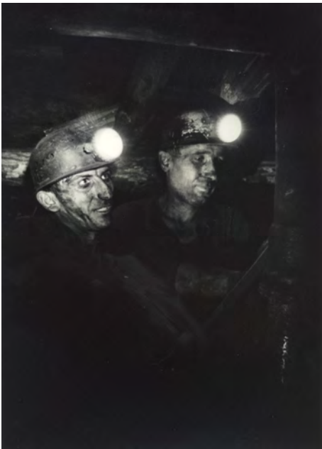
Kohlengrubenarbeiter, Katowice, Polen 1971

Neiße-Grenze geschickt worden, und es war ziemlich mühsam, weil der Dolmetscher sehr genau beobachtet hat, was ich fotografierte. Dem bin ich entgangen, indem ich vor dem Frühstück schon das Hotel verlassen und Bilder gemacht habe und dann rechtzeitig wieder zurück war. Dem Redakteur ist es auch wunderbar gelungen, unseren Begleiter mit Fragen abzulenken – so konnte ich fotografieren. In Polen konnte ich nach langem Insistieren sogar in ein Bergwerk einfahren und die Arbeitsbedingungen unter Tage kennenlernen. Ich habe gesehen, unter welchen Strapazen die Stempel von Hand gesetzt wurden und wie schnell das gehen musste, damit nichts nachbrach. Licht gab es nur durch die Grubenlampe, die ich oben auf dem Helm trug; das war ein wahnsinnig schwieriges Fotografieren. Als ich oben wieder ankam, dachte ich, ich hätte mindestens 10 Loren mit Kohle gefüllt, so erschöpft war ich. Zu erleben und zu zeigen, wie die Leute dort arbeiten mussten, war mir ungemein wichtig.