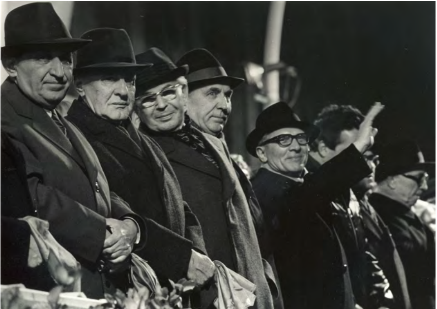
30. Jahrestag der DDR mit den Ostblockführern, Berlin 1979

Beim 30. Jahrestag der DDR 1979 hatte ich eine Akkreditierung für den Palast der Republik. Hinterher mussten die Westfotografen auf die andere Seite der Straße Unter den Linden, um den Fackelaufmarsch zu fotografieren, aber die Tribüne mit der Prominenz war auf der gegenüberliegenden Seite, also war nichts zu sehen von all den Ostblock-Bonzen. Deshalb bin ich den Gästen nachgelaufen, die aus dem Palast der Republik herauskamen, aber ich hatte keine Ahnung, wo sie hingehen würden, und landete plötzlich vor der Tribüne. Da ging das Antichambrieren mit den Sicherheitsleuten los, die merkten, dass ich auf die andere Seite gehörte, und mich wegschicken wollten. In solchen Fällen habe ich eine freundliche Penetranz, und das Ganze zog sich über eine Stunde hin. Irgendwann kam jemand und sagte: „Frau Klemm, fotografieren Sie mal, aber stören Sie die Kollegen nicht.“ In dem Moment standen alle oben vor mir auf der Bühne – Schiwkow, Gierek, Kádár, Husák und Honecker. Ich bekam die ganze Ostblock-Führung auf ein Bild, alle gleich aussehend mit denselben Hüten auf und mir freundlichst in die Kamera lächelnd. Auf dem Rückweg von der Veranstaltung wusste ich genau, dass mir ein tolles Bild ge- glückt war, und die drei, vier Stunden in der Kälte waren vergessen.