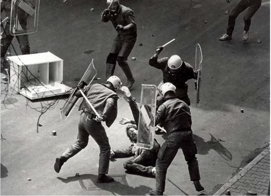
Beim Besuch Präsident Reagans, Berlin 1982

ein Bild ergeben hat – Sie haben selbst schon den Begriff der Inszenierung gebraucht. Ein Beispiel wäre das Foto von 1982, wo drei Polizisten einen auf der Erde liegenden jungen Mann einkreisen und ihre Knüppel schwingen – das könnte kein Choreograph besser inszenieren.