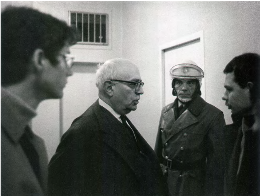
Theodor W. Adorno, Institut für Sozialforschung, Frankfurt a.M. 1969