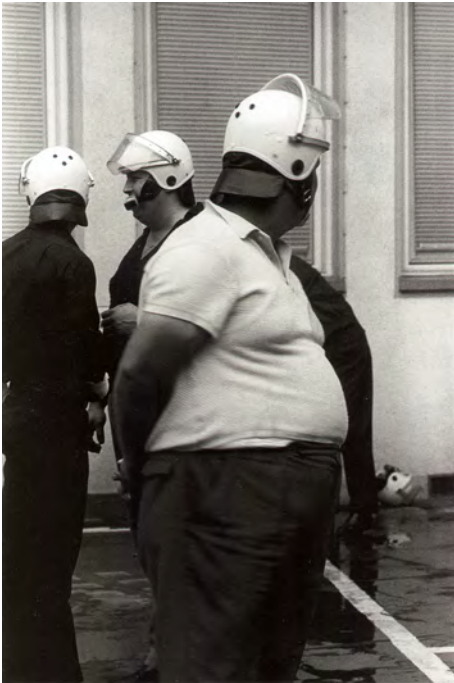
NPD-„Saalschutz“, Frankfurt a.M. 1969

fangen. Es entstand 1969 und wurde ein Schlüsselbild der Studentenrevolte. Ein anderes ganz wichtiges Bild, mit dem ich das erste Mal auch politisch etwas erreicht habe – was leider sehr selten geschieht –, war ein Foto aus dem Bundestagswahlkampf 1969, als die NPD mit Saalschutz aufgetreten ist. Bei einer Veranstaltung in Frankfurt gab es ganz fette Ordner, die ich fotografiert habe, wirklich miese Typen. Das Bild wurde zuerst natürlich in der „FAZ“ veröffentlicht, dann im „Spiegel“ und in der gesamten europäischen Presse nachgedruckt. Außenminister Walter Scheel hat damals gesagt, ich hätte mit dem Foto mehr als alle Parteien dazu beigetragen, dass die NPD an der Fünfprozenthürde scheiterte.