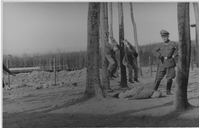
Zwei Häftlinge hängen mit auf dem Rücken gefesselten Armen an Bäumen. Ein dritter Häftling liegt vor dem in die Kamera schauenden Mann in der Uniform eines SS-Unterscharführers auf dem Boden. Ganz links läuft eine Person aus dem Bild.

Baumhängen, Foto A, nach dem 11. April 1945