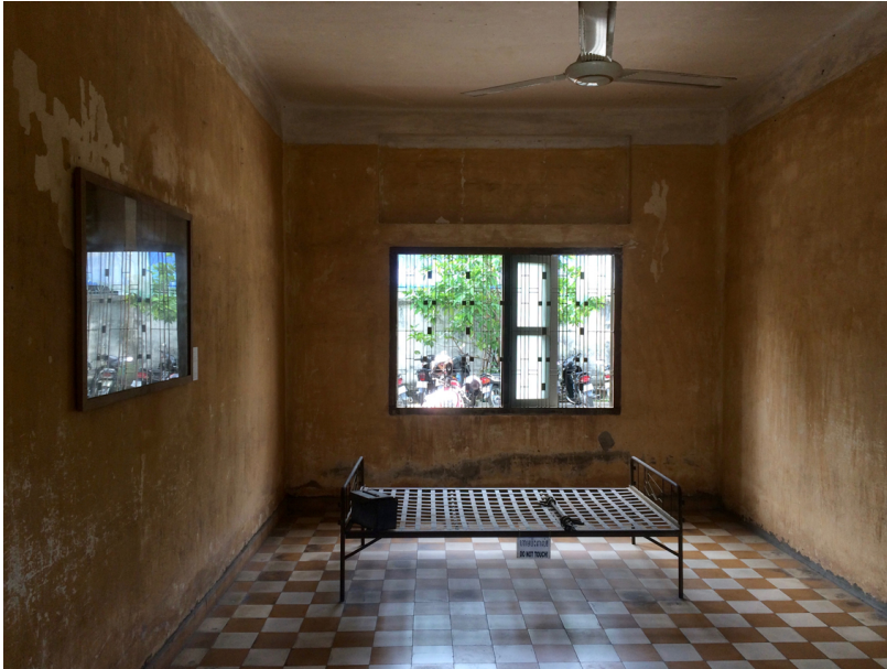
Abb. 1: Die Tuol Sleng-Gedenkstätte in Phnom Penh (Kambodscha) befindet sich im ehemaligen Gefängnis S-21 der Roten Khmer und dient der Erinnerung an die dort begangenen Verbrechen während des Genozids in Kambodscha zwischen 1975 und 1979. In dem hier abgebildeten Raum wurden Gefangene gefoltert. Ihre Fotos sind Teil der Ausstellung in der Gedenkstätte; die Gesichter der Folteropfer werden durch einen schwarzen Balken unkenntlich gemacht. Ein solches Foto ist auf dieser Aufnahme links im Bild vom Fensterlicht verspiegelt zu sehen.

Foto: Annette Vowinckel, Phnom Penh, 15. September 2017, Lizenz: CC BY-SA 3.0