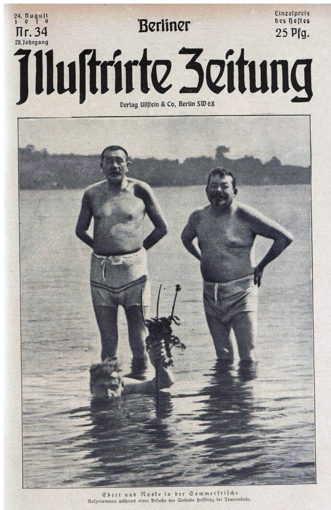
Abb. 3: Das „Badebild“ von Friedrich Ebert wurde als Vorveröffentlichung am 21. August 1919, dem Tag seiner Vereidigung auf die Weimarer Reichsverfassung, als Ausschnitt auf der Titelseite der „Berliner Illustrierten Zeitung“ in diffamierender Absicht unter der Bildunterschrift „Ebert und Noske in der Sommerfrische“ veröffentlicht. Es spielte in der Kampagne gegen das Staatsoberhaupt und die Weimarer Republik eine besondere Rolle, denn es machte Ebert lächerlich. Viele Menschen insbesondere aus bürgerlichen Kreisen waren über den Anblick des entblößten Reichspräsidenten mit ausgebeulter Badehose schockiert. Das Bild eines Haffkruger Strandfotografen wurde in zahlreichen Varianten sowie als Fotomontage zu meist in rechtskonservativen Publikationen und als Postkarte verbreitet.