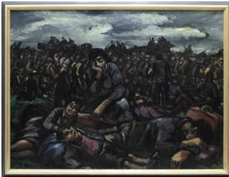
Frans Masereel (1889-1972), Kriegsflüchtlinge 1941, Öl auf Malkarton, 74,5 x 100 cm. © Die Frans Masereel Stiftung in Saarbrücken und die Stiftung Studienbibliothek zur Geschichte der Arbeiterbewegung in Zürich halten gemeinsam die Rechte am Werk Masereels.

Im Juni 1940 floh der belgische Grafiker und Maler Frans Masereel vor der nach Paris einmarschierenden Wehrmacht nach Südfrankreich. Dort schuf er im Jahr darauf ein Gemälde, das heute den Titel Kriegsflüchtlinge trägt. Im Vordergrund des 74,5 mal 100 cm großen Bilds liegen unter freiem Himmel drei Personen auf dem Erdboden. Ihre Köpfe ruhen auf Gegenständen, die wie Gepäckstücke aussehen, die Augen sind geschlossen. Hinter ihnen sitzt, ebenfalls mit geschlossenen Augen, eine vierte Figur, die den Kopf in die rechte Hand stützt und mit der linken einen Koffer hält; ein weiterer Koffer steht am rechten Bildrand. Die links liegende Figur ist vermutlich eine Frau, die einen Rock und eine Andeutung von Lippenstift trägt. Bei der mittleren Person handelt es sich um ein Kind in kurzen Hosen, dessen Körper deutlich kleiner ist als der der weiblichen Figur. Das Gesicht der Person rechts im Bild wird von einer Hand verdeckt; der Kurzhaarschnitt, die Kleidung und die relativ großen Hände legen die Vermutung nahe, dass es sich um einen Mann handelt. Die sitzende Figur erinnert in ihrer Körperhaltung an eine Pietà, eine trauernde Muttergottes. Es ist nicht ausgeschlossen, dass die drei liegenden Personen tot sind. Ihre Körperhaltung und Gesichtszüge legen aber eher den Gedanken nahe, dass sie vor Erschöpfung eingeschlafen sind.