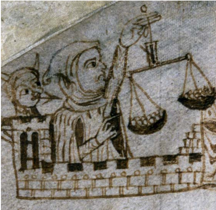
Unbekannte Figur mit Mütze (Detail)

Vermutlich war auch sie eine reale, identifizierbare Person. Mehrere jüdische Frauen namens Avegaye sind in den zeitgenössischen Dokumenten bezeugt. Darüber hinaus gibt es eine vierte, unbenannte, menschliche Figur am linken Bildrand.