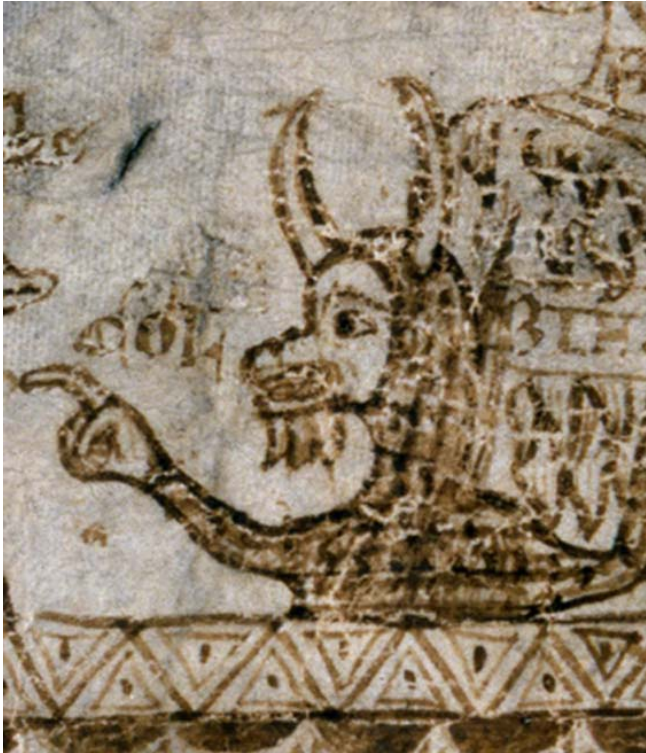
Colbik (Detail)

Eine nochwitzigere Pointe gibt es im Zusammenhang mit dem Dämon in der Mitte und seiner teuflischen Kohorte. Die vorherrschende Lesart der Karikatur sieht sie als furchterregende und geschmähte Verbündete der Juden, als angebliche Agenten der Hölle. Alle Wissenschaftler*innen, die über dieses Bild geschrieben haben, folgen dem verstorbenen Sir Cecil Roth, indem sie den Namen des Teufels als „Colbif“ lesen, ein ansonsten unbestätigtes Wort, von dem man annimmt, es beschwöre einen alten heidnischen Gott oder Dämon herauf. Vermutlich weist es so auf jüdische Andersartigkeit und jüdischen Unglauben hin. Dies würde sicherlich zu einer Lesart des Bildes als eine vernichtende Anklage des jüdischen Verrats passen.