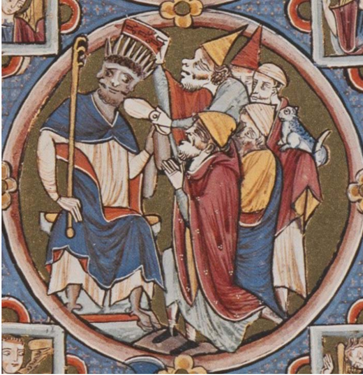
Detailansicht des „Antichristen“ im Kommentar zum 2. Buch der Könige, der „Bible moralisée“, Paris, circa 1225

Künstler wollte, indem er Isaak drei Gesichter gab, ihn anscheinend mit dem Antichristen gleichsetzen, dem legendären Bösen, dessen Erscheinen am Ende der Zeit die Wiederkunft Christi einläuten würde. Dieser wurde in den zeitgenössischen Manuskripten als dreigesichtige, gekrönte Figur dargestellt.