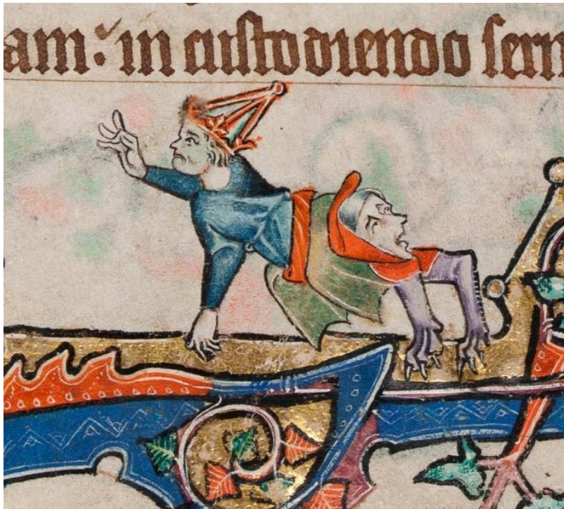
„Die Feige geben“ (Detail) from „The Macclesfield Psalter“, circa 1330

An erster Stelle versäumt diese Interpretation, den signifikanten visuellen Unterschied zu erkennen, den es zwischen den drei zentralen jüdischen Figuren und dem sogenannten jüdischen Wucherer ganz links gibt. Deren Gesicht ist verzerrt – im Fall Isaacs monströs – im Gegensatz zum Gesicht des angeblichen Wucherers. Sie befinden sich im zentralen Hof des mit Zinnen bewehrten Gebäudes; er steht weiter unten, außerhalb, an der Seite. Die drei sind namentlich gekennzeichnet; er bleibt unbenannt. Und während Mosse und Avegaye von den Dämonen verspottet, angefasst, bedroht werden und Unbehagen zeigen, bleibt er allein. Oder besser gesagt, er schließt sich den Dämonen an, indem er sie ebenfalls verspottet: Er rümpft die Nase, und während er die Waage hochhält, legt er seinen Daumen zwischen Zeige- und Mittelfinger – eine altehrwürdige Geste der Verachtung, die als „die Feige geben“ bekannt ist (das mittelalterliche Äquivalent zum „Stinkefinger zeigen“).