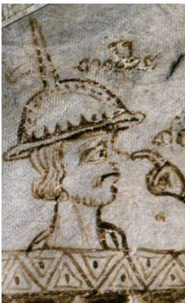
Mosse Mokke (Detail)

Der Mann mit dem gehörnten Hut, links von Isaak, ist „Mosse Mokke“. Auch er war ein im Geldhandel von Norwich tätiger Jude. Zweimal diente er als Eintreiber der Steuern der Juden für den König, einmal wurde er von Isaak angestellt, einen säumigen Schuldner zu verprügeln.