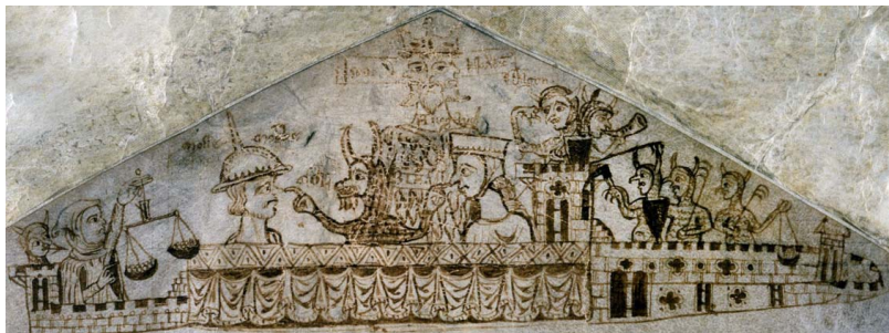
Oberer Rand der Steuerrolle des Schatzamtes (Exchequer Receipt Roll), Hilary and Easter Terms, 1233, Quelle: The National Archives , London

Die älteste bekannte antijüdische Karikatur ist eine Zeichnung – eigentlich ein detailliertes Gekritzelt – am oberen Rand eines königlichen englischen Steuerprotokolls von 1233. [1] Sie zeigt drei merkwürdig aussehende Juden, die sich in einem schematisch dargestellten Schloss befinden, das von einer Gruppe karikaturesker, gehörnter Dämonen mit schnabelartigen Nasen angegriffen wird. Ein weiterer größerer Dämon in der Mitte des Schlosses zeigt auf die sonderbar langen Nasen zweier Juden, als ob er die Ähnlichkeit zwischen ihren Profilen und seinem eigenen betonen wollte.