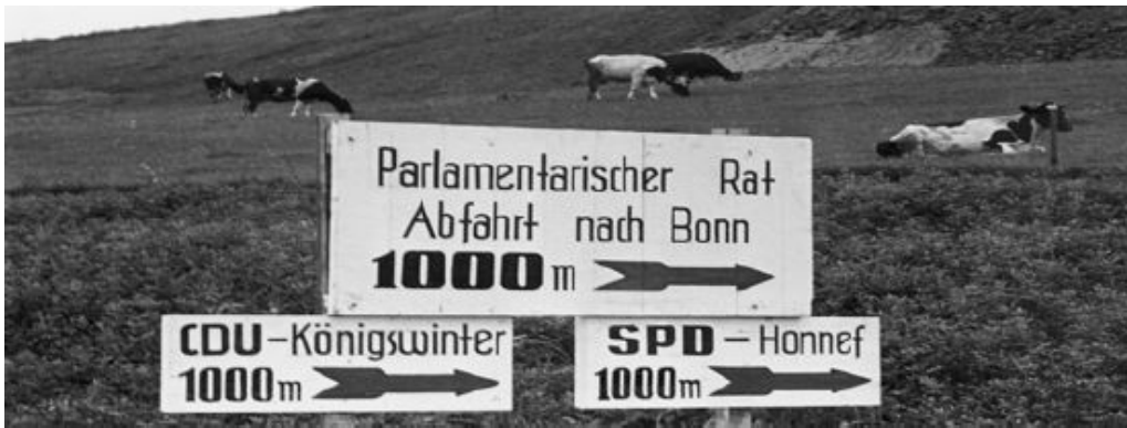
Autobahnabfahrt Bonn mit Hinweisschildern, 1. September 1948, Foto: Hanns Hubmann © bpk-Bildagentur mit freundlicher Genehmigung