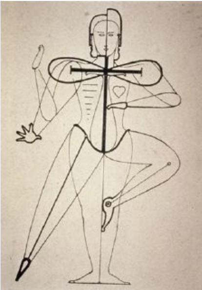
Oskar Schlemmer: Skizze zum Thema Entmaterialisierung, aus dem Aufsatz Mensch und Kunstfigur, in: Die Bühne im Bauhaus (Bauhausbücher 4), München 1925, S. 7-24, hier S. 17, Quelle: Wikimedia Commons (gemeinfrei)