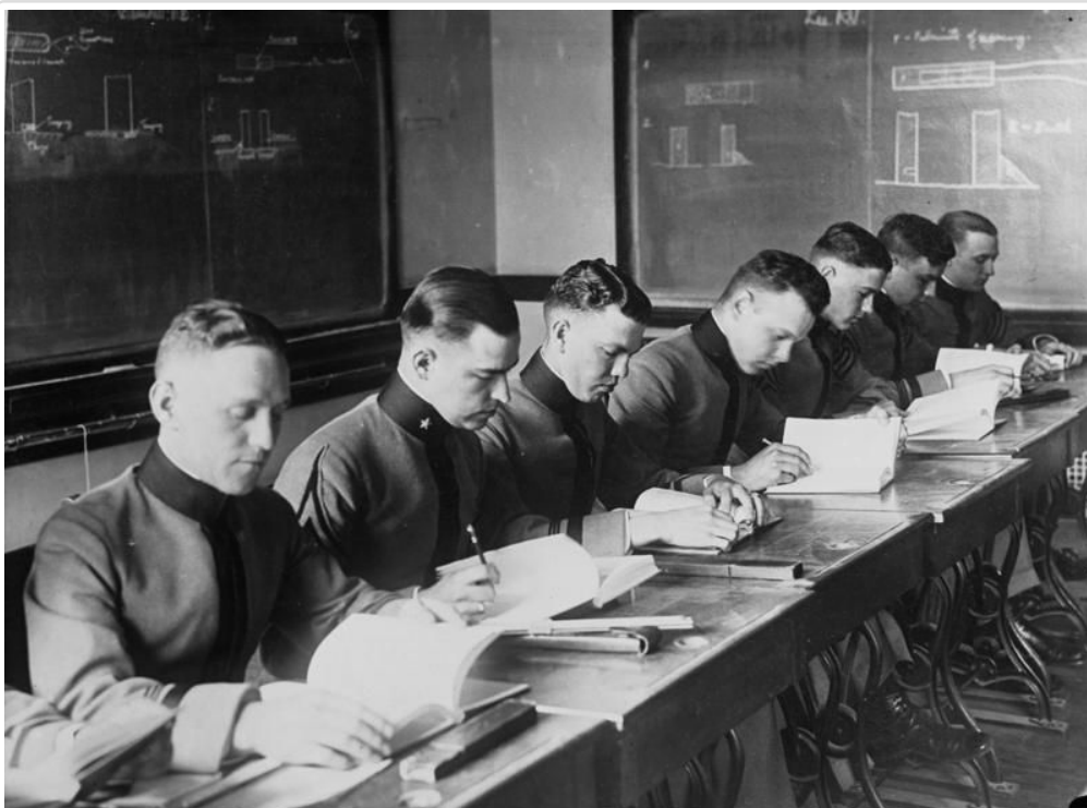
Schule und Militär – zwei Institutionen moderner Subjektivierung. Unterricht in der Offiziersschule West-Point, USA 1929.

Schulen oder Familien, so bleiben systematische Fragen nach der Genese von Gouvernementalität und ihren Grenzen vorerst offen. Foucault selbst beantwortet diese Probleme genealogisch. Seit dem 18. Jahrhundert konstatiert er einen Konnex zwischen der Freiheit des Einzelnen und der Sicherheit, der Kontrolle des Objekts „Bevölkerung“. [8] Die sich ausprägende liberale Form von Regierung funktioniert nicht durch Disziplinierung des Einzelnen, sondern durch seine Ermächtigung und Initiative zur Selbstregierung. Im Sinn einer liberalen Gouvernementalität wird Freiheit zu einer legitimierenden Begründung für Staaten, die Freiheit ihrer Macht- und Wissensdispositive gewissermaßen funktional einzubinden. Freiheit provoziert insoweit Machttechnologien: „Wenn es Machtbeziehungen gibt, die das gesamte soziale Feld durchziehen, dann deshalb, weil es überall Freiheit gibt.“ [9] Das Subjekt ist der Nukleus dieser Regierungsform und seiner Objektivierungs- und Veridiktionsstaktiken. Die „Spiele der Wahrheit“, die Akte von Prüfung, von Bekenntnis, von Selbstthematization, die an bestimmte Formen von Wahrheit gebunden sind, installieren subjektivierende Machtbeziehungen. [10]