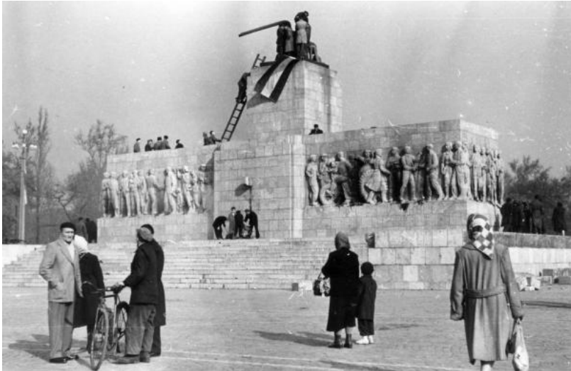
Die zurückgebliebenen Stiefel des Stalin-Denkmal nach dessen Sturz am 23. Oktober 1956

[1] Michael Gehler/Erich Lessing, Ungarn 1956. Aufstand, Revolution und Freiheitskampf in einem geteilten Europa, Innsbruck 2015, S. 41.