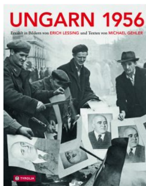
Cover: Erich Lessing/Michael Gehler, Ungarn 1956. Aufstand, Revolution und Freiheitskampf in einem geteilten Europa © mit freundlicher Genehmigung Tyrolia Verlag

In einem Hof hat sich eine große Menschenmenge versammelt. Frauen und Männer blicken zu einem glockenförmigen Lautsprecher empor, der die Debatten aus dem Budapester Offiziersclub überträgt. Einige sind auf Fenstersimse der angrenzenden Häuser geklettert. Drinnen tagt der Petöfi-Kreis, ein Gesprächsforum junger Literaten und Intellektueller, und diskutiert über Fragen zur Presse- und Informationspolitik. An diesem 27. Juni 1956 hatten die Veranstalter 600 Zuhörer erwartet, gekommen waren zwischen 6000 und 7000. [1] Die Debatten dauerten bis in die frühen Morgenstunden und entließen ihre Teilnehmer mit der Gewissheit, dass sich etwas ändern müsse in ihrem Land. [2]