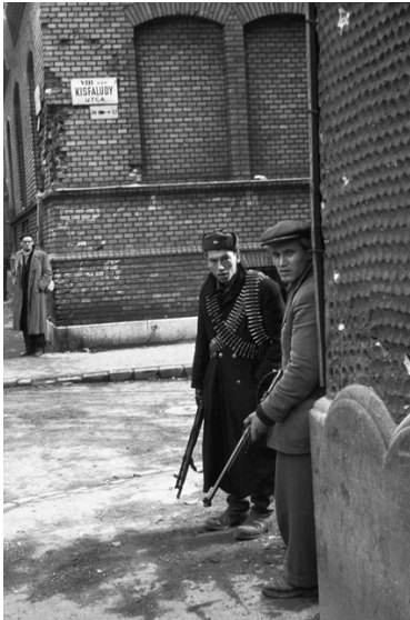
Erich Lessing: Zwei Aufständische an einer Ecke der Kisfaludy-Allee im Zentrum von Budapest. Budapest 1956 © mit freundlicher Genehmigung