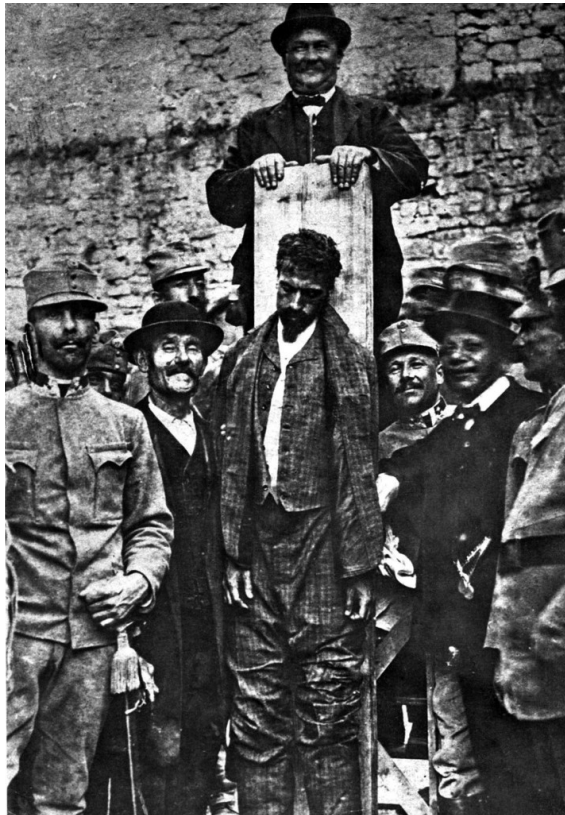
Die Hinrichtung des italienischen Patrioten Cesare Battisti, Trient, 12. Juli 1916, Fotograf: namentlich nicht bekannter österreichischer Kriegsphotograf. Abb. aus: Anton Holzer, Das Lächeln der Henker. Der unbekannte Krieg gegen die Zivilbevölkerung, Darmstadt 2014, S. 24

Neben der Darstellung dieses Kriegs gegen die Bevölkerung versucht sich Holzer der Frage zu nähern, was für Motive die Täter wie die zahlreichen Schaulustigen hatten, sich mit den Opfern am Galgen fotografieren zu lassen. „Beutestücke einer abgründigen Schaulust“ (S. 10) nennt Anton Holzer diese Bilder, die er in Archiven in Tschechien, in Polen, in der Ukraine, in Serbien und Montenegro, in Bosnien und Slowenien gefunden hat. Sie waren dort, im Gegensatz zu westlichen offiziell-militärischen Sammlungen, wo es solche Fotos nicht geben durfte, archiviert worden, um die brutale und unrechtmäßige Kriegführung der Mittelmächte zu beweisen. Denn die Vorfälle waren keineswegs Exzesse Einzelner, sondern zentraler Teil der militärischen Strategie bei Kriegsbeginn, um die „verdächtige“ Zivilbevölkerung mit Zwangsdeportationen, Internierungen und systematischen Hinrichtungen zu „bändigen“ (S. 13). Nach zeitgenössischen Berichten waren es allein für die k.u.k. Monarchie zwischen 11.400 und 36.000 Zivilisten, die in den ersten Kriegsmonaten am Galgen ermordet wurden. (S. 19)