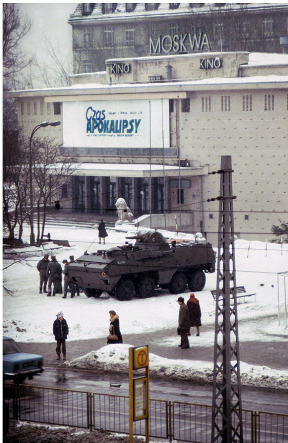
Chris Niedenthal, „Apocalypse Now“, Warschau, 14. Dezember 1981: „Armoured personnel carrier outside Moscow Cinema in Warsaw, December 1981, first days of martial law. The film showing: Coppola's „Apocalypse Now“