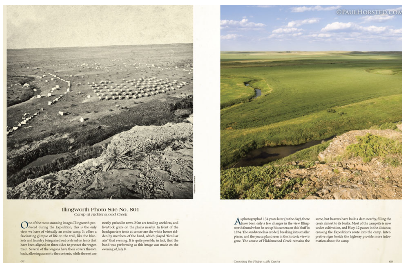
Illingworth Photo Site No. 801 Camp of Hekkerwood Creek

One of the most stunning images Illingworth produced during the Expedition, this is the only view we have of virtually an entire camp. It offers a fascinating glimpse of life on the trail, like the blankets and bedding being used over dried-out tents that have been aligned on three sides to protect the wagon track. Several of the wagons have their covers thrown back, allowing access to the contents, while the rest are neatly parked in rows. Men are tending coolboxes, and livestock graze on the plains nearby. In front of the headquarters tents at center are the white horses ridden by members of the band, which played "Tambour and Drum" every night. It is quite possible, in fact, that the band was performing at this image was made on the evening of July 8.