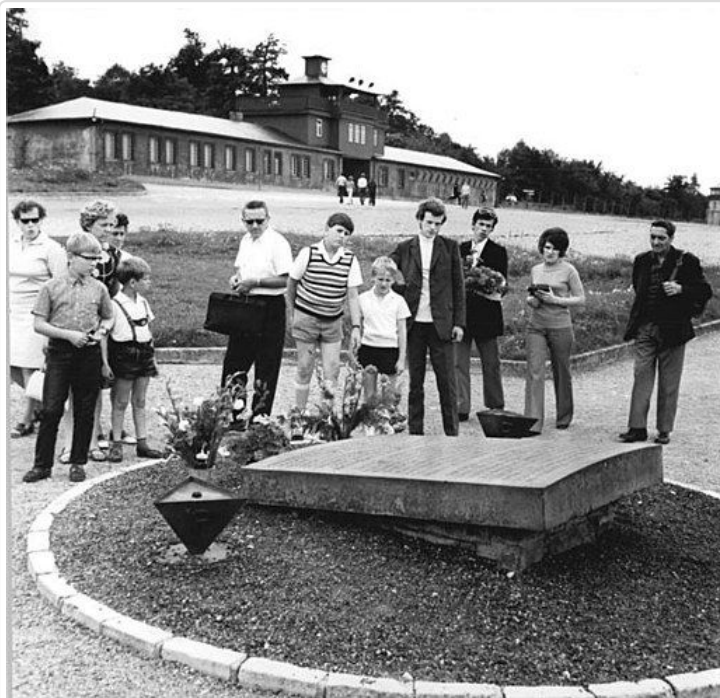
Durch Pflichtbesuche wurden Gedenkstätten in der DDR gezielt auch als politisches Erziehungsinstrument eingesetzt. Gedenkstein für ermordete polnische Häftlinge in der Nationalen Mahn- und Gedenkstätte Buchenwald, 15. August 1972.