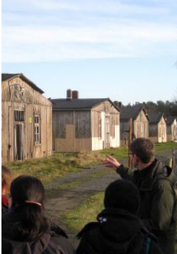
Teilweise rekonstruierte Baracken des ehemaligen Kriegsgefangenen-Stammlagers X B nahe Sandbostel, 14. Januar 2012.