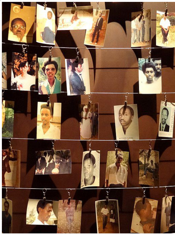
Das „Kigali Genocide Memorial Centre“ zeigt neben körperlichen Überresten und Kleidungsstücken auch Fotografien der Opfer des Genozids in Ruanda im Jahr 1994.

In globaler Perspektive haben sich historische Stätten des gewaltsam verursachten Leidens von Menschen zu prominenten Bestandteilen einer (kultur-)touristischen, urbanen Museumslandschaft entwickelt. Manche dieser neu entstandenen Orte nehmen deutlich mehr oder anders gewichtete Aufgaben als die europäischen Gedenkstätten wahr. Das „Robben Island Museum“ in Südafrika ist für die gesamte ehemalige Strafkolonie, auf der unter anderem Nelson Mandela inhaftiert war, einschließlich der (touristischen) Infrastruktur und aller Bauten sowie der Natur verantwortlich; im „Mission Statement“ des Museums ist das Gedenken an die Opfer nicht als eigene Aufgabe benannt.