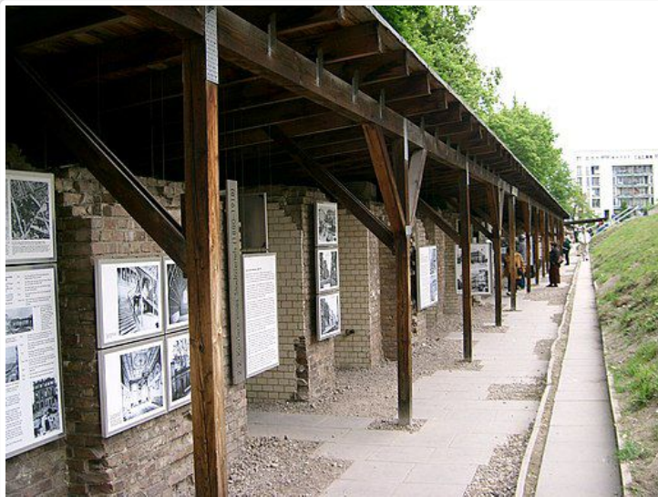
Die „Topographie des Terrors“ dokumentiert in Berlin die Verbrechen des Nationalsozialismus. Das Dokumentationszentrum entwickelte sich aus bürgerlichen Initiativen seit den 1970er-Jahren, die zur 750-Jahr-Feier der Stadt 1987 in einer ersten Ausstellung mündeten, und ist heute fester Bestandteil der Berliner Erinnerungsorte. Fotograf: edwin.11, 17. Mai 2004, Quelle: Wikimedia Commons, Lizenz: CC BY 2.0

Als Orte geschichtspolitischer Bedeutung und Funktion befinden sich Gedenkstätten zwischen hegemonialen, staatspolitischen Zuschreibungen und pluralen, konfliktiven Geschichtsbildern auch weiterhin an der Schnittstelle multipler Konfliktlagen und Deutungskonkurrenzen. So sind im Zuge soziopolitischer Transformationsprozesse in vielen (europäischen) Ländern in den letzten beiden Jahrzehnten wieder vermehrt nationsbezogene Deutungsmuster bekräftigt worden, indem Gedenkorte der Legitimation einer neu gewonnenen politischen Unabhängigkeit dienten oder über sie neue Identitätsnarrative verhandelt wurden. [105] Ähnliche Funktionen sollen Europamuseen erfüllen, in denen die Erinnerung an den Holocaust, das Ende des Zweiten Weltkriegs oder die Überwindung des Totalitarismus als Schlüsselmomente und Weichenstellungen eines europäischen Integrationsnarrativs fungieren. [106]